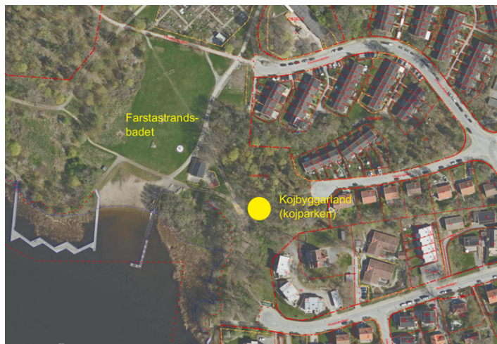
Kojbyggartland öster om Farstastrandsbadet

Under tiden 2019 till 2022 genomfördes en stor insats för att stärka eksambanden mellan Magelungen och Drevviken. I samband med åtgärden fälldes ett stort antal träd för att ge ekarna förbättrade levnadsförhållande. I samband med detta röjdes även sly. Återröjning av sly enligt en upprättad plan har utförts sedan arbetet med eksambanden genomfördes. De träd som står på platsen bedömdes viktiga att bevara för den biologiska mångfalden då träden står i en spridningszon som utgör en del av ett ekologiskt särskilt betydelsefullt område (ESBO).